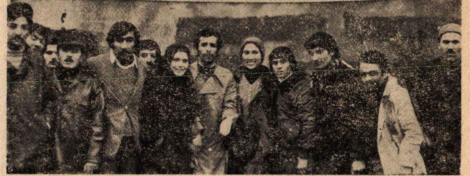
Grevdeki EVMA işçileri.

İŞÇİ SINIFININ MÜCADELESİ BİRLİK OLMaktan GEÇER