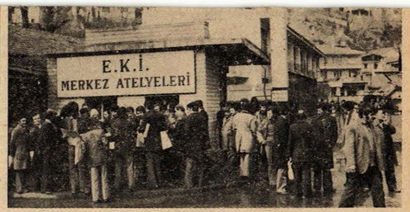
E.K.I. Merkez Atölyesi İşçileri İşçi Davası Gazetesini alırken.

Bu arada, İspanya'nın Vizcaya kentinde 15 bin ve Guipuzcoa ken- tinde 6.700 işçi ücret zammı ve di- ğer ekonomik haklar için başlat- tıkları grevi sürdürmektedirler.