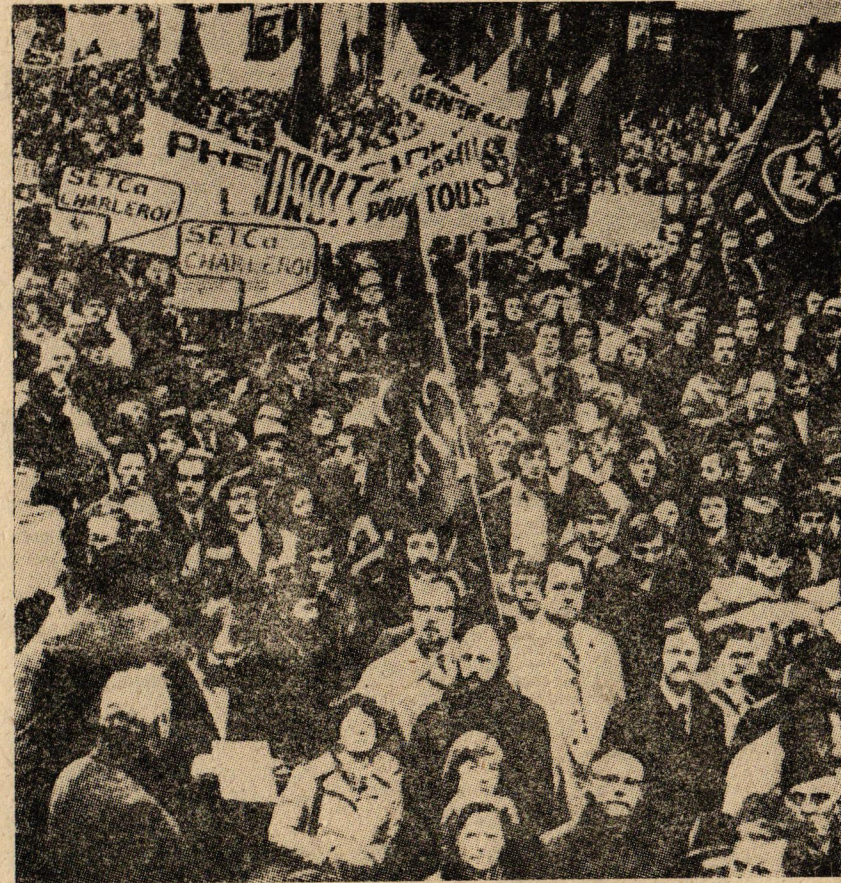
Fransa'da 4 milyondan fazla işçinin katıldığı grev ve gösterilerden bir görüntü