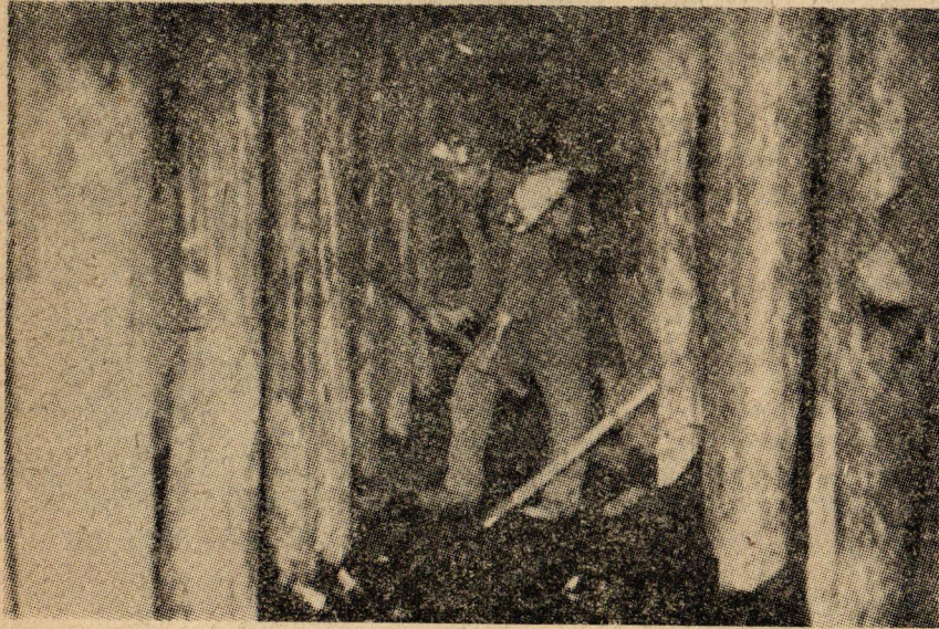
İşçiler halâ ortaçağ şartlarında çalıştırılıyor.